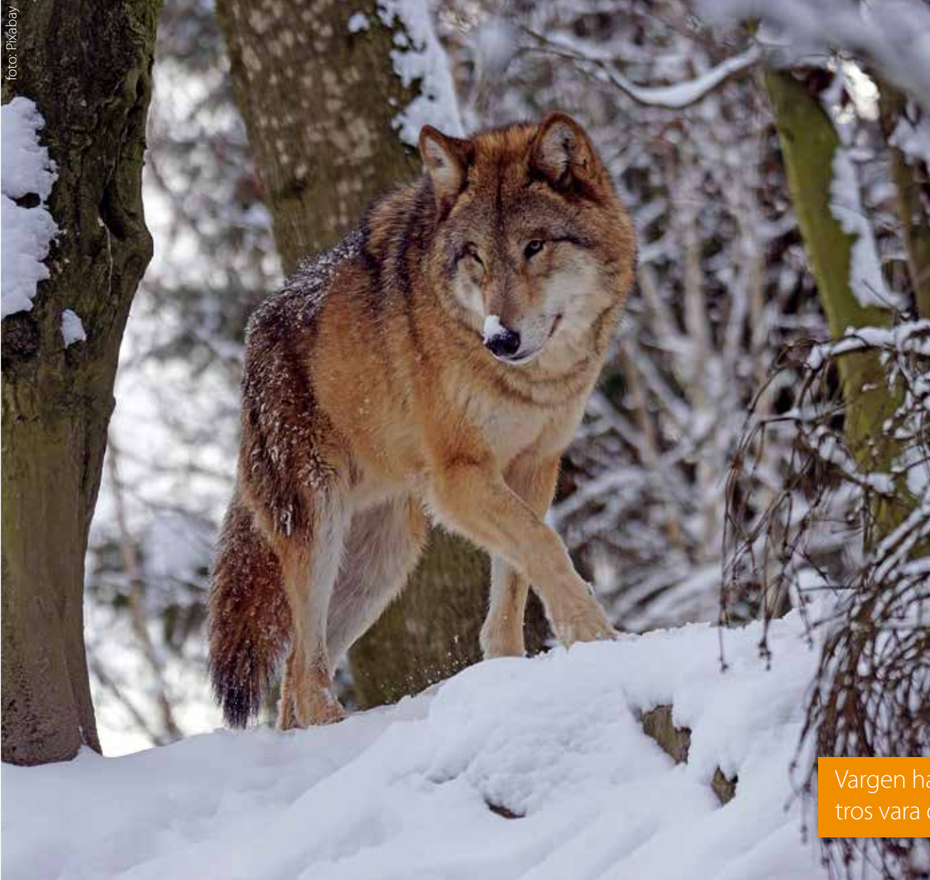
Listig varg i skogen