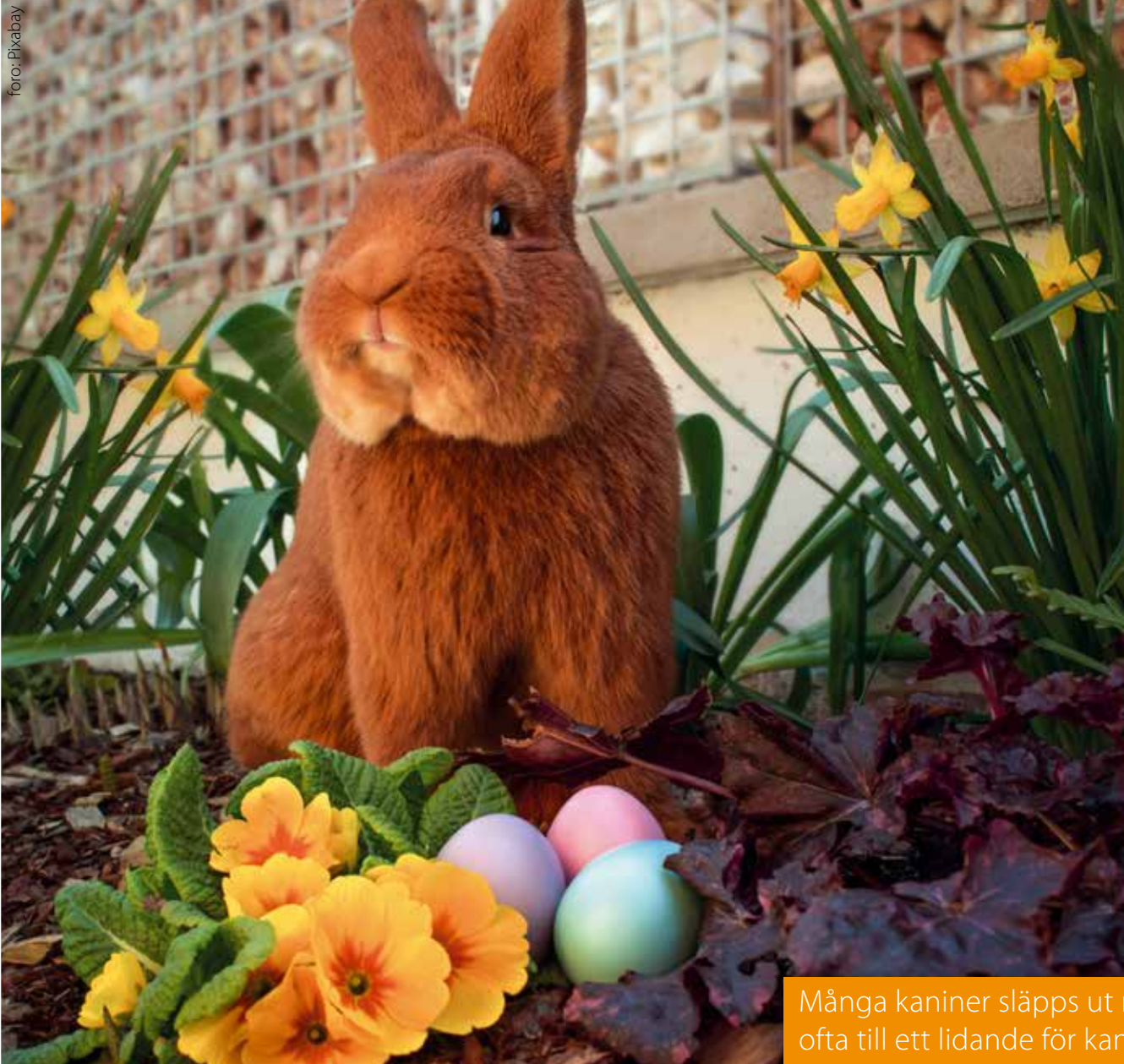
Kaninen önskar Glad Påsk!

Kaniner är sociala djur som mår bäst om de får leva på stora ytor med en artfrände. Du måste vara beredd att spendera mycket tid på att vara med din kanin varje dag. Mest ska de äta hö/gräs och annat bladgrönt. Till skillnad mot vad många tror är det inte bra för kaniner att äta morötter då de innehåller för mycket socker. Det går att lära en kanin att bli rumsren.