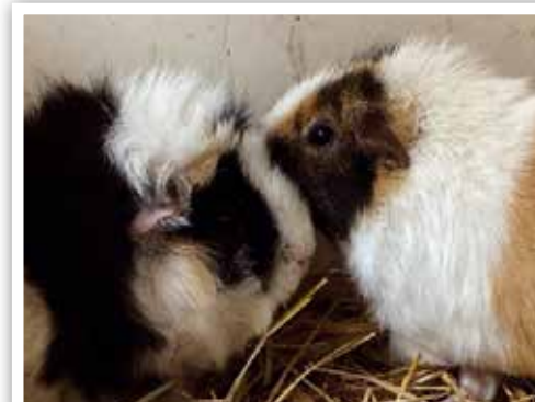
Marsvin som gömmer sig i höhögar.

Dessa marsvin hittades i en buske men har fått en ny chans i livet genom Malmö Djurskyddsförening.