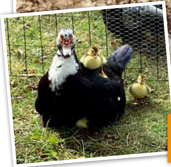
Muskankungar med sin mamma.

Vad passar bättre i en liten sjö än en familj muskankor? Precis så tänkte ägarna av restaurangen strax utanför Malmö. Ankorna flyttade in och fick ett eget litet hus där honan la ägg som resulterade i 20 små ankungar. För att skydda djuren mot rovfåglar byggdes en inhägnad. Idag är ankorna tama och särskilt sällskapliga på morgonen när det är matdags. Favoritfödan är majs men även olika sorters frön, vete, korn och havre smakar gott för muskankorna.