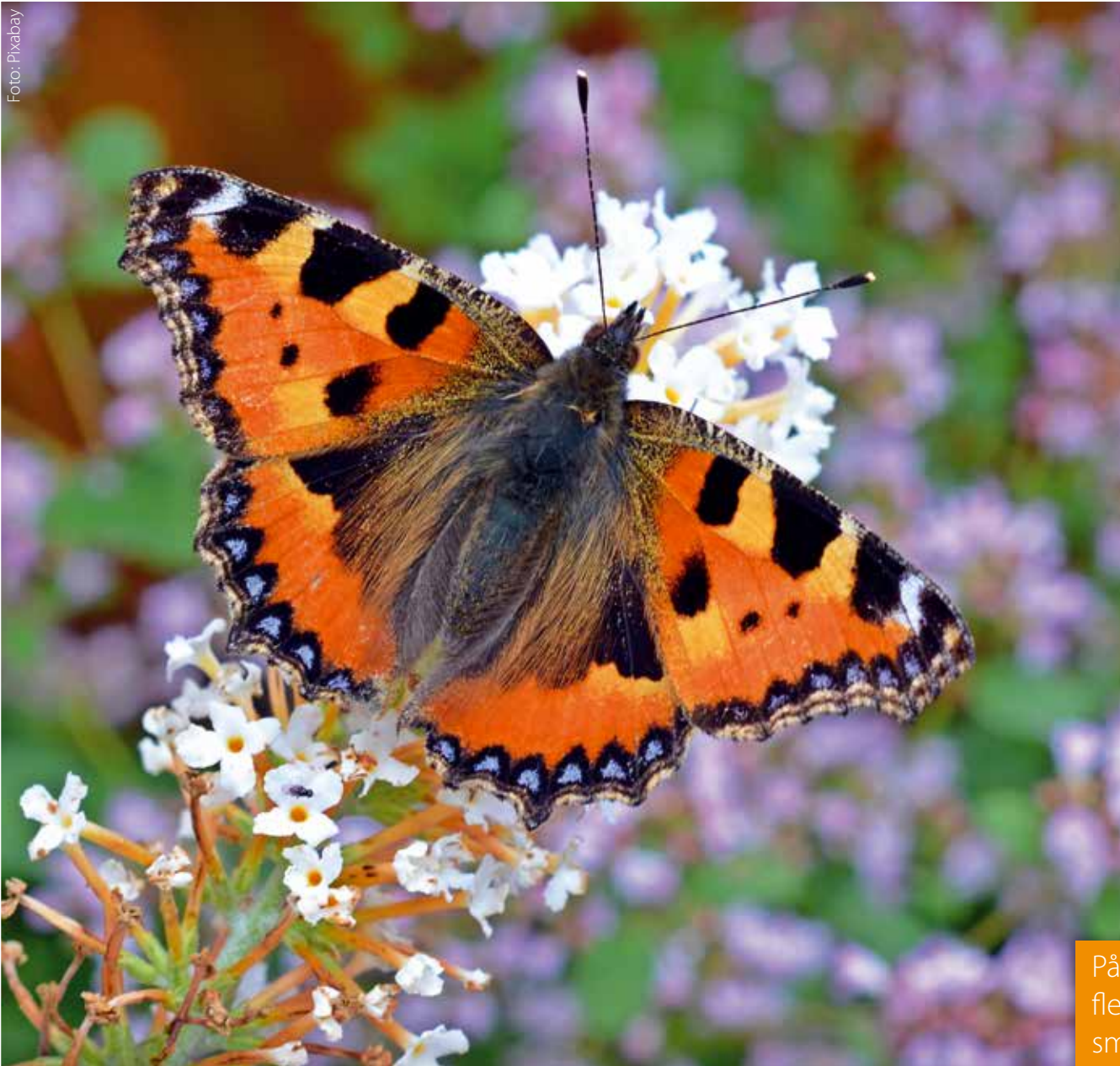
Nässelfjäril som suger nektar med sin sugsnabel.

Nässelfjärilen är en av Europas vanligaste fjärilar och den trivs särskilt bra i trädgårdar, betesmarker och längs vägkanter där de äter nektarrika blommor. Den är ofta en av de första fjärilarna man ser på våren då den övervintrar som fullt utvecklad fjäril. Varma vinterdagar kan den kvickna till från vinterdvalan och flyga omkring. Du kan hjälpa insekter som vaknar tidigt på året genom att erbjuda nektar och pollenrika växter som blommor tidigt på våren.