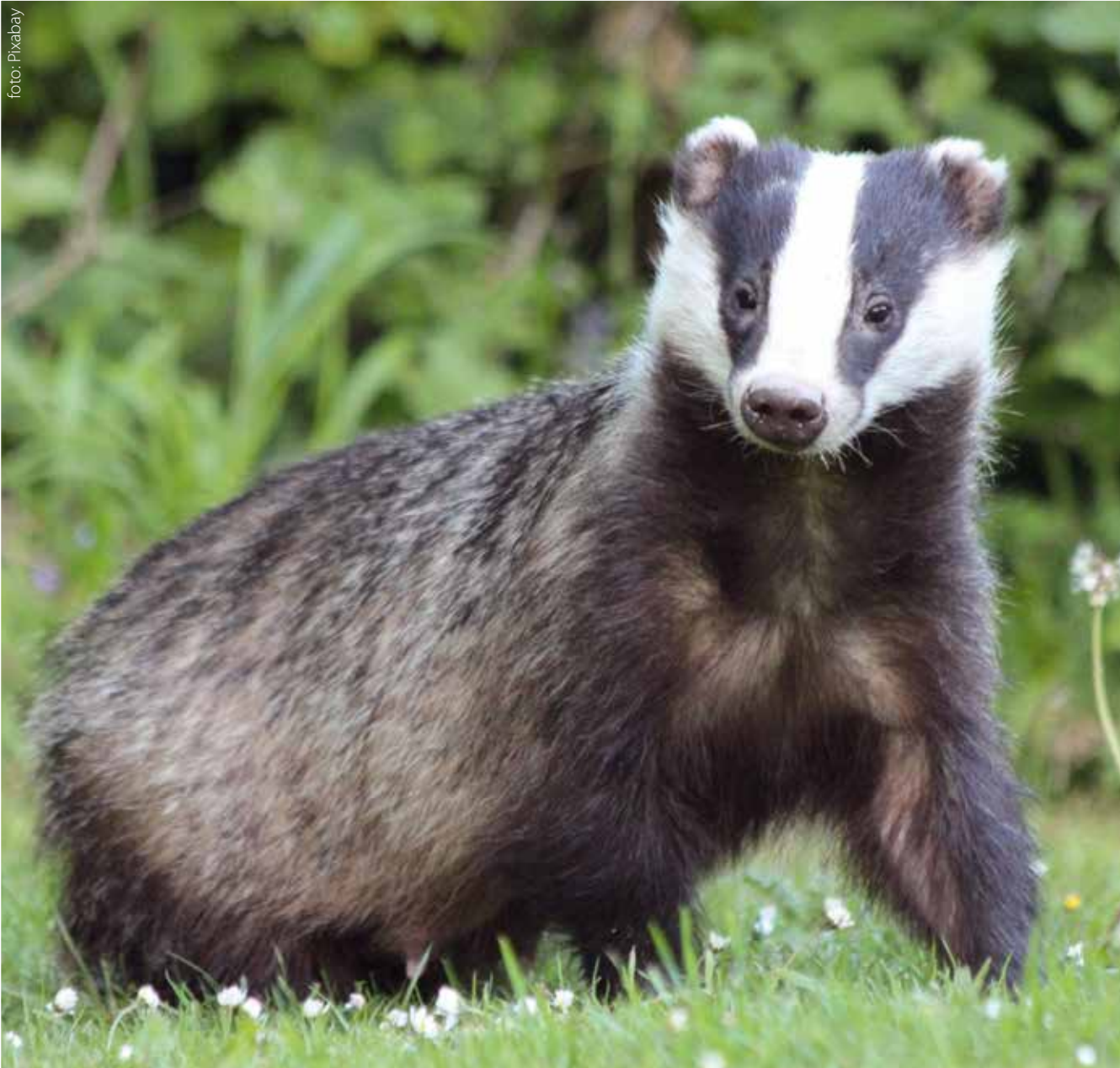
Nyfiken grävling tittar fram.

Grävlingen finns i hela Sverige utom allra högst upp i norr och på Gotland. Den är mest aktiv om nätterna. Favoritfödan är daggmaskar, men som den allätare grävlingen är, står även växter och smådjur som grodor och häckande fåglar på menyn. Grävlingen ser dåligt men är mycket känslig för dofter. Den är skygg men attackerar inte människor, men kan bita ifrån om den känner sig trängd.