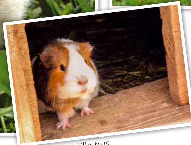
Marsvin i sitt lilla hus

Hamstern är mycket aktiv och vill ha klätterställningar i buren. Marsvinet gillar hus och tunnlar att krypa in i och att mumsa på höbollar.