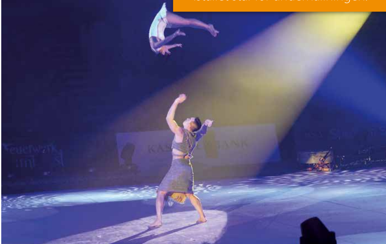
Akrobater på cirkus

Välj cirkusar utan djur där människorna istället står för underhållningen.