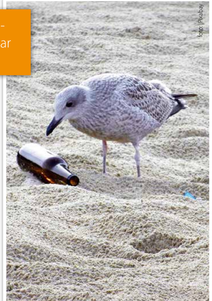
Fiskmåås som undersöker skräp

Vårt skräp skadar djuren. När djur äter plast istället för mat blockeras deras matsmältning vilket i värsta fall leder till döden. Djuren kan också fastna och trassla in sig i det.