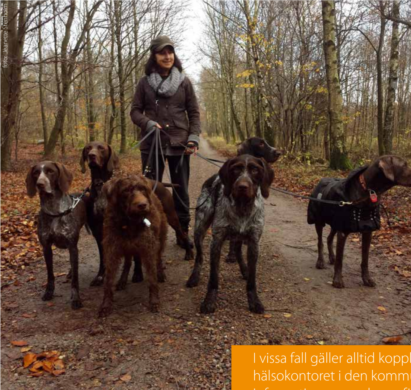
Skogspromenad med hundar

Ta gärna med dig hunden i naturen, men för att skydda fåglar och vilt är kraven på hundägaren stora. Det är bara extremt vildresserade hundar som kan få gå lösa under perioden 1 mars till 20 augusti. I praktiken får hunden om den är lös vara högst någon meter ifrån dig. Hundägare har så kallat "strikt ansvar" för sin hund. Det innebär att du hålls ansvarig för skada som din hund orsakar även om någon annan passar den.