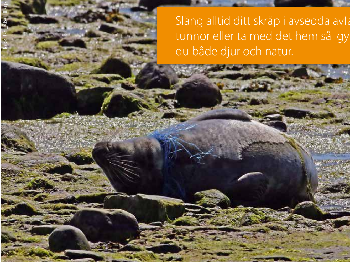
Säl som fastnat i i ett fisknät

Släng alltid ditt skräp i avsedda avfallstunnor eller ta med det hem så gynnar du både djur och natur.