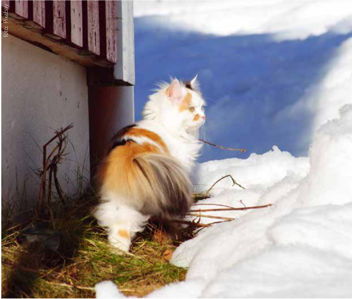
Katt som myser i vintersolen