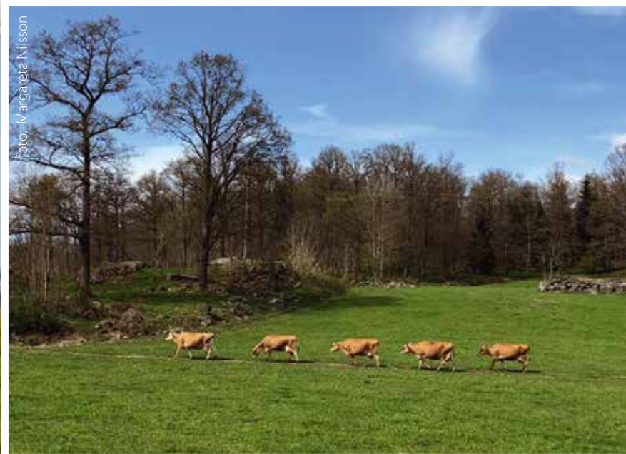
Glada kor på på äventyr

Betesdjur hjälper till att bevara den biologiska mångfalden och hålla landskapen öppna. Fler lantbruksdjur behöver få tillgång till utevistelse. Det ger välmående djur!