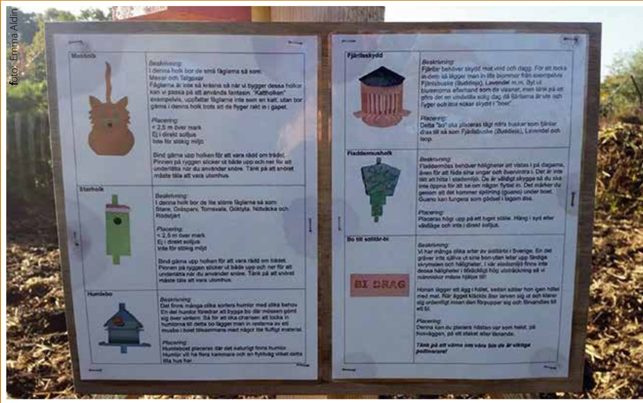
Malmö Stads fina exempel från Slottsträdgården.

För de flesta innebär ett nytt år längtan till den härliga sommaren. Förbered dig i god tid att ge våra viktiga små-djur platser att bo i.