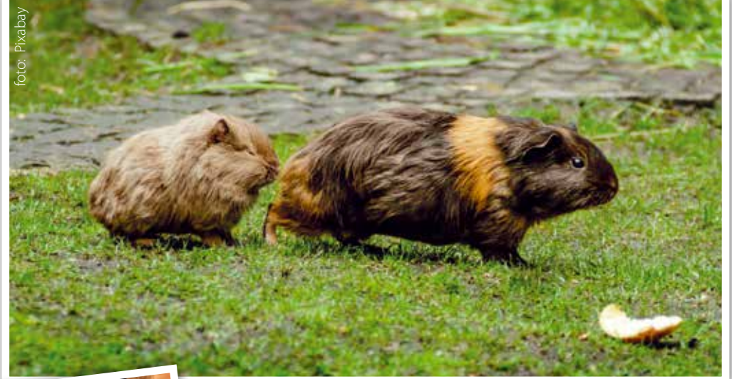
Marsvin på språng