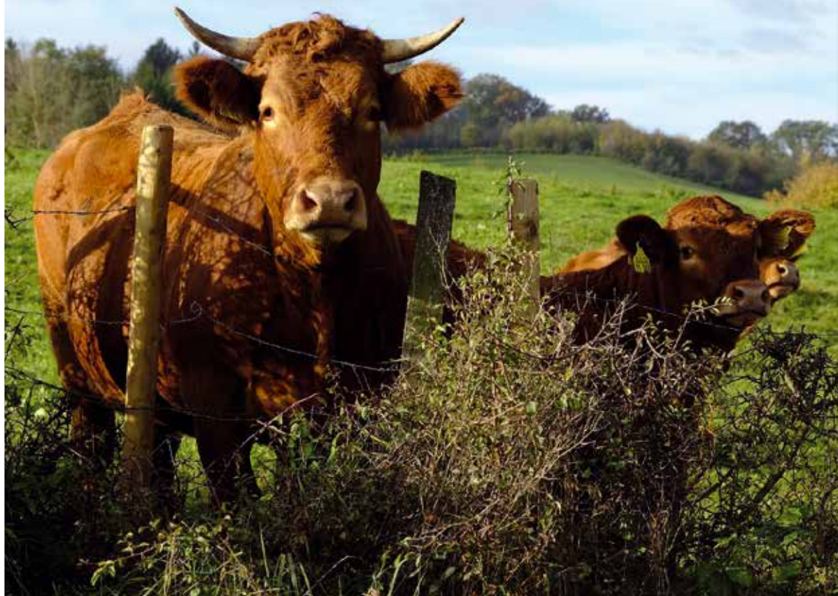
Kor på grönbete