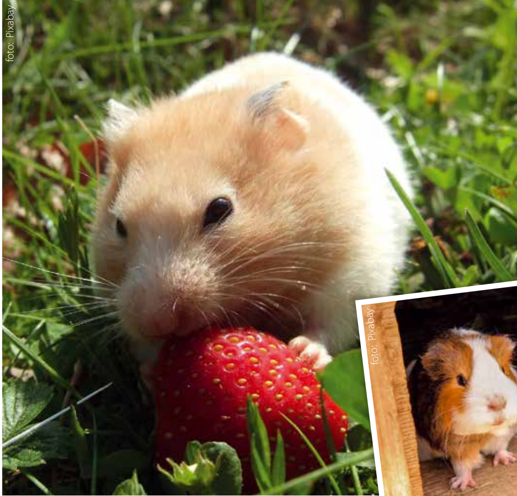
Hamstern gillar att äta fruk och bär