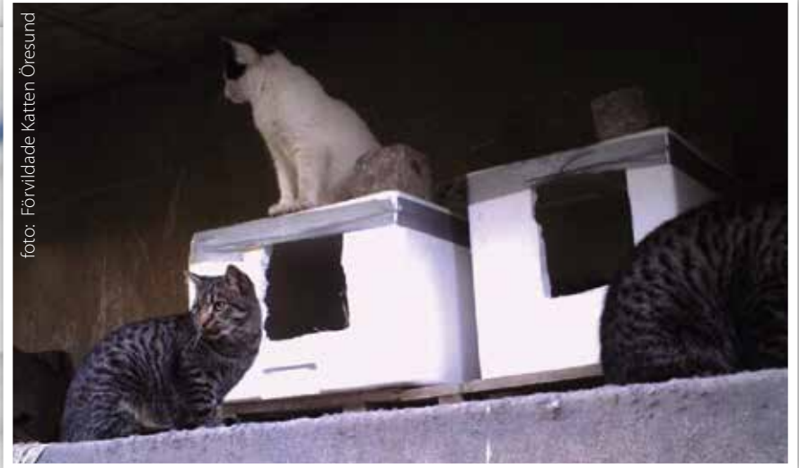
Frigolithus till förvildade katter

Om du inte har möjlighet att ge katterna ett hem kan du hjälpa dem genom att ställa ut frigolithus. Tips hur sådana byggs ihop går att söka på nätet. Det är viktigt att alla katterna kastreras. Det håller nere beståndet plus att katterna lägger till sig hull.