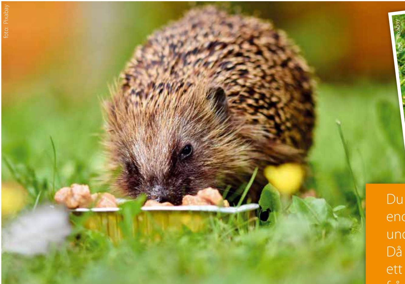
Igelkott som mumsar i sig föda