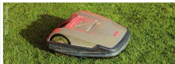
Robotgräsklippare - ett stort hot för igelkottar!