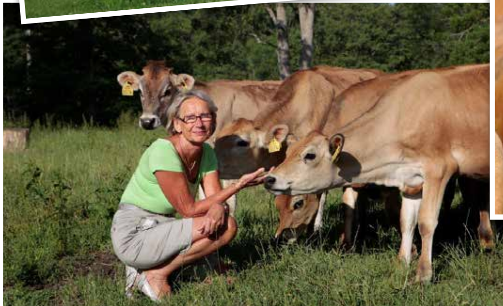
Mamma Mu med alla de sina...

Betessäsongen börjar 1 april och varar till 31 oktober i södra Sverige.