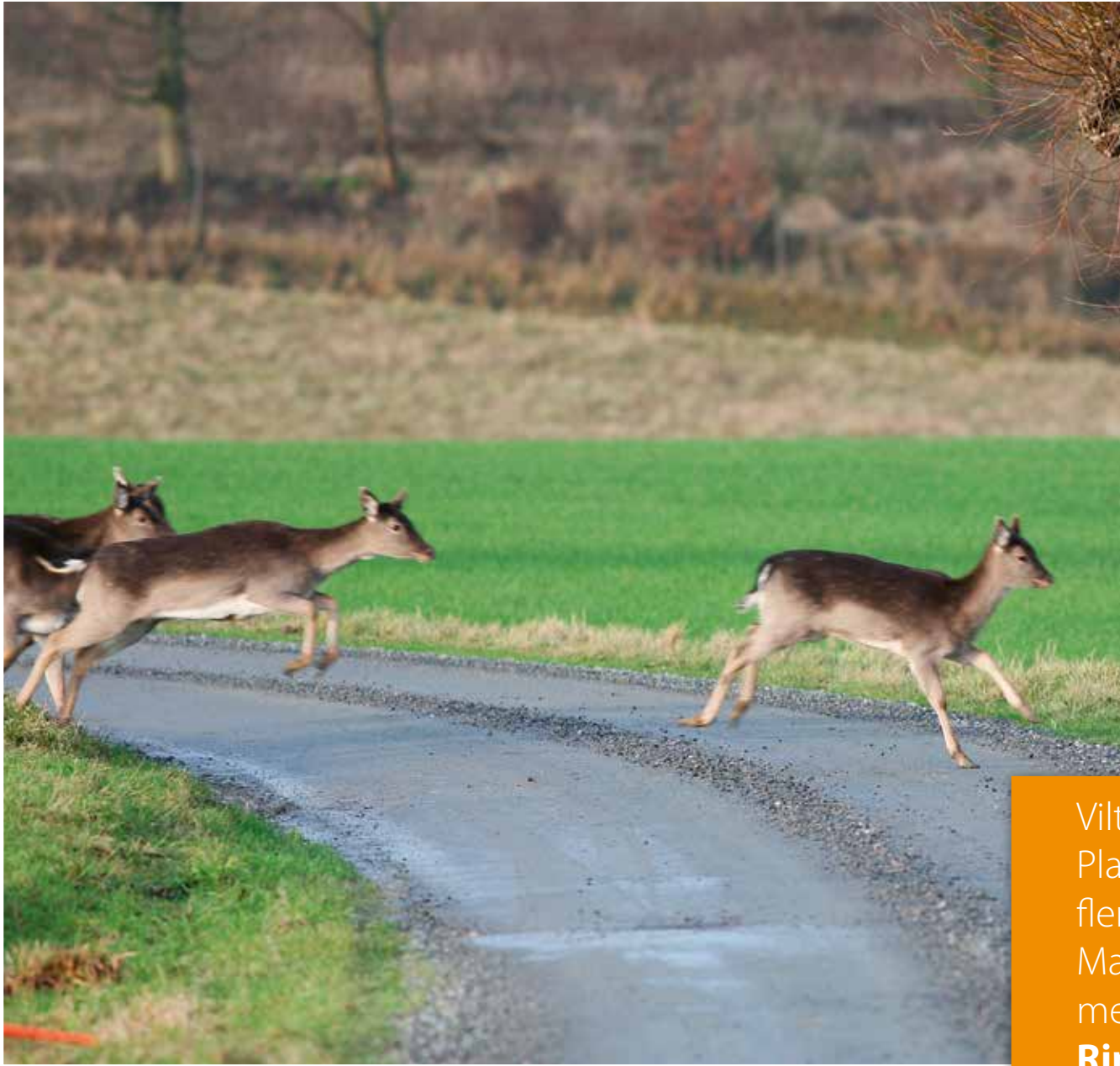
Dovvilt över väg

Flest antal viltolyckor i Sverige inträffar under november månad. Var extra försiktig under gryning och skymning.