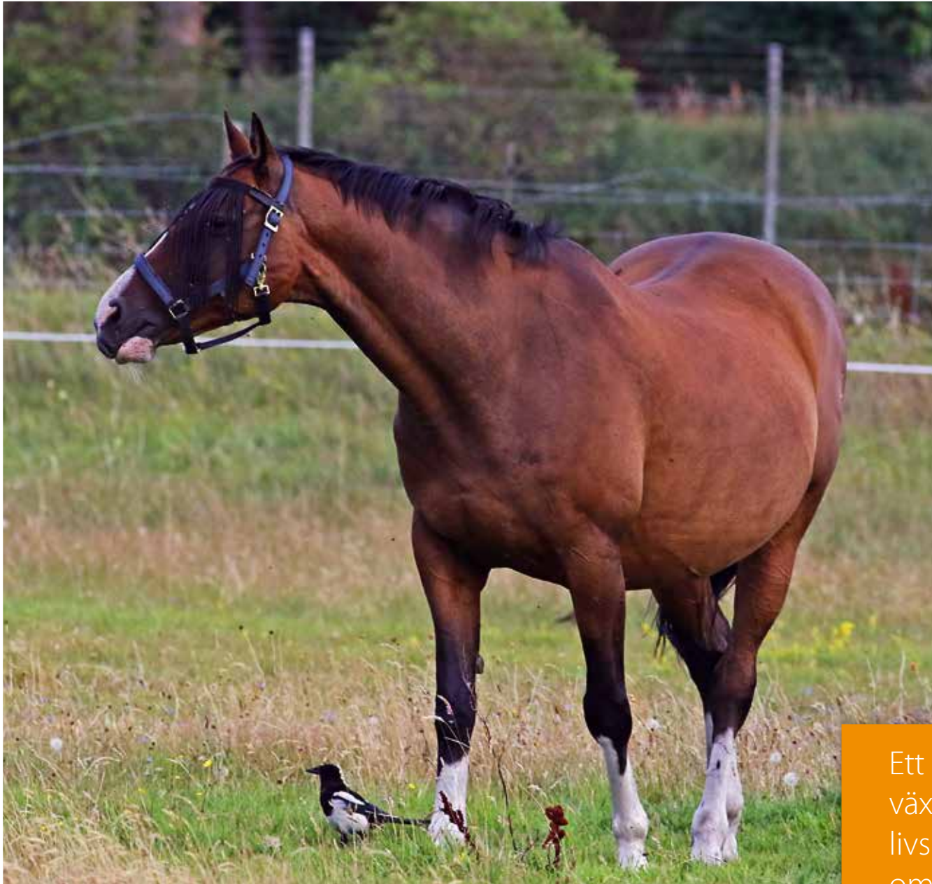
Häst och skata

Hästen och skatan drar nytta av varandra. Detta kallas för samliv eller symbios. Hästen skrämmer upp småkryp som skatan äter, och som tack tar skatan bort fästingar och flugor som irriterar hästen. Många djur och växtarter lever i symbios. Detta beroende mellan arter gör dem mer utsatta då de ibland inte kan leva utan varandra. Det är därför viktigt att värna om våra ekosystem.